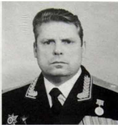
Главного штаба ВВС по боевому управлению, 1989—1993 — старший препода-

С 1982 по 1987 — начальник штаба — зам. командующего ВВС МВО, 1987—1988 — начальник штаба — зам. командующего ВВС ставки ВГК ЮА (г. Баку), 1988—1989 — зам. начальника