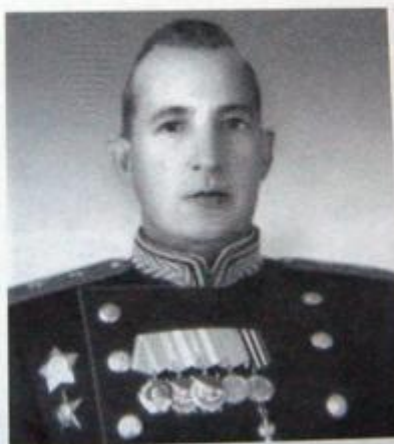
Участник Великой Отечественной войны: командир 12-й смешанной

Родился 14 (27) июля 1901 г. в с. Новотомниково Тамбовской губ. Окончил высшее начальное училище (1917). Вармии с 1920. Служил в пехоте. Окончил 1-ю Московскую школу военных железнодорожных техников (1922). До 1923 – служил в железнодорожных войсках. Окончил Киевскую военно-теоретическую школу ВВС (1925), Качинскую ВАШЛ (1927). Служил в Ленинградском военном округе. Окончил КУКС при Военно-воздушной академии им. Н.Е. Жуковского (1932), Липецкую высшую лётно-тактическую школу (1936). Командовал эскадрилей, авиабригадой, дивизией в Белорусском военном округе.