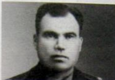
1970—1972 — зам. командующего 1-й особой Дальневосточной ВА по боевой подготовке, 1972—1974 — консультант

В армии с 1944 г. Окончил 11-ю ВАШПОЛ (1945), Сталинградское ВАУЛ (г. Новосибирск) (1947), Фрунзенское ВАУЛ (1949). До 1955 — лётчик-инструктор. Окончил ВВА (Монино) (1958). С 1958 по 1965 — на лётно-инструкторской работе в Сызранском полку, 1965—1970 — командир полка, командир дивизии,