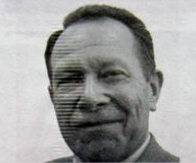
«Агат» в г. Жуковском, начальник лаборатории — зам. главного конструктора,

Родился 10 ноября 1936 г. в с. Прибытки Тамбовской обл. Окончил МГУ им. М.В. Ломоносова (1959). С 1959 по 1986 — работал в ОсКБ-15 в г. Жуковском — инженер, старший инженер, ведущий инженер, ведущий конструктор, начальник лаборатории — зам. главного конструктора. С 1986 — в ОАО МНИИ